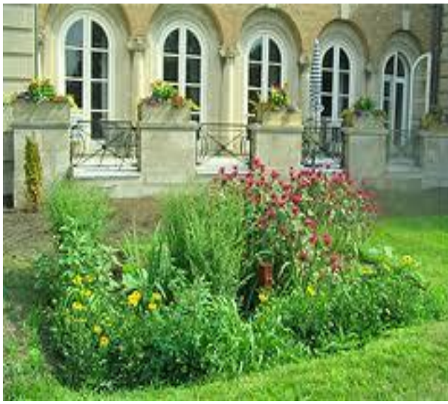
Ejemplo de un jardín de lluvia abundante..